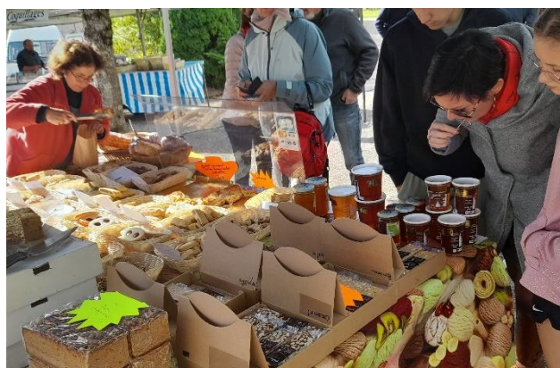
Marché de printemps