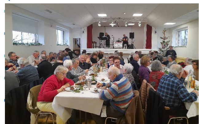
Banquet de nos aînés