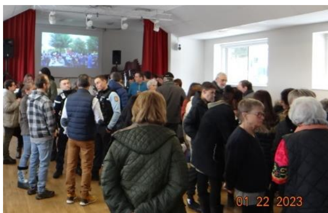
Cérémonie des vœux