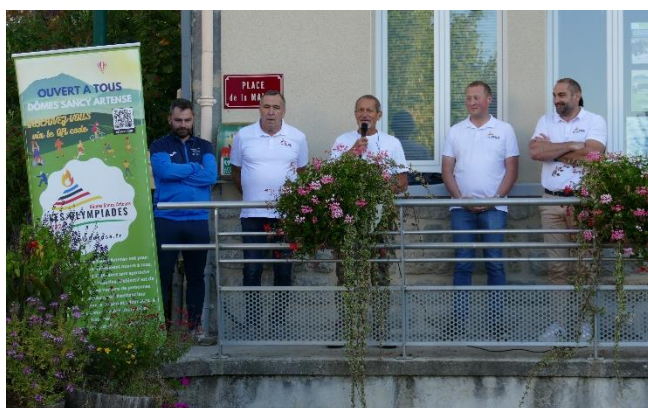
Passage de la flamme olympique