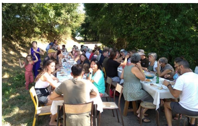
Repas au four de Pruns