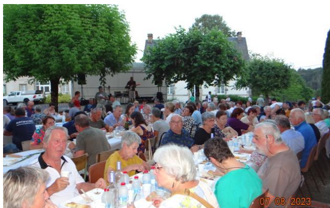
Fête patronale (repas du samedi soir)