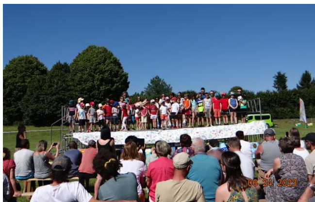
Kermesse de l'école