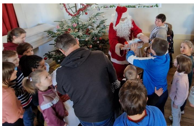
Arbre de Noël des enfants de Larodde