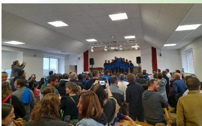
Remise des maillots – Club de foot Sancy Chavanon