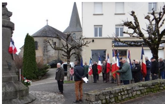
Cérémonie commémorative du 19 mars