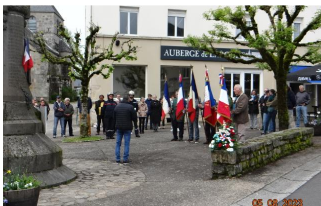
Cérémonie commémorative du 8 mai