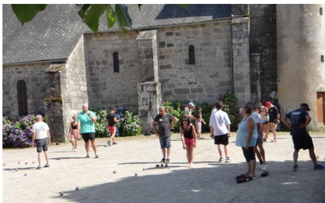
Fête patronale (concours de pétanque)