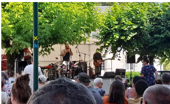
Fête patronale (concert avec Oubéret le dimanche)