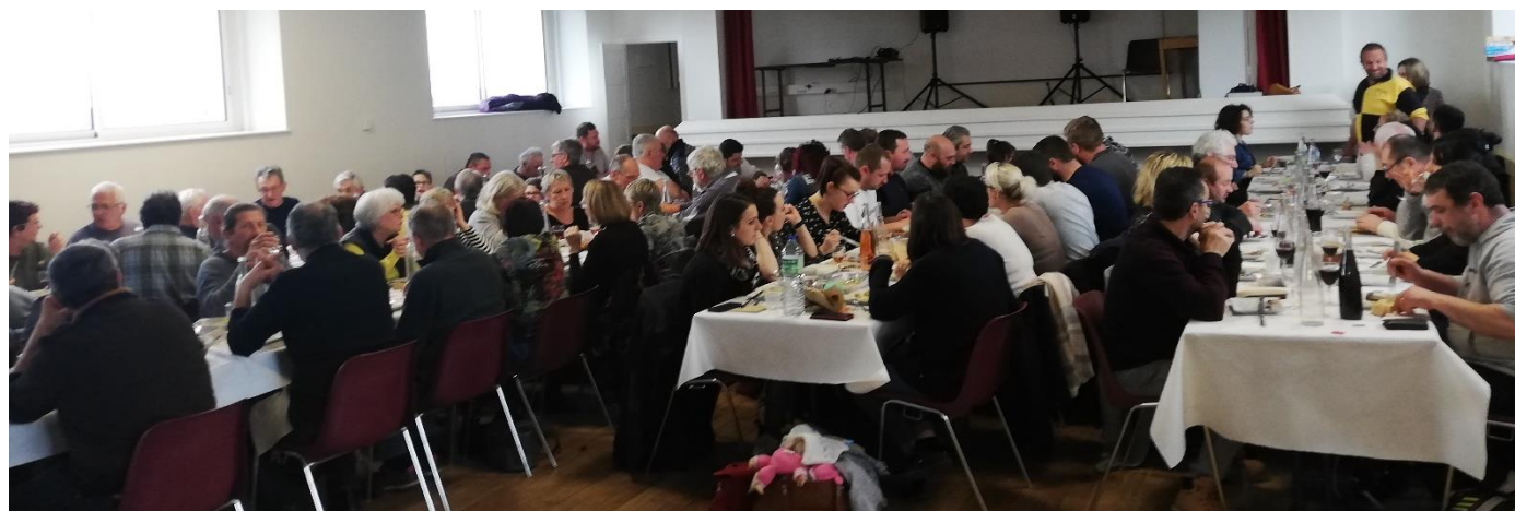
Repas de la chasse - 1.03.2020