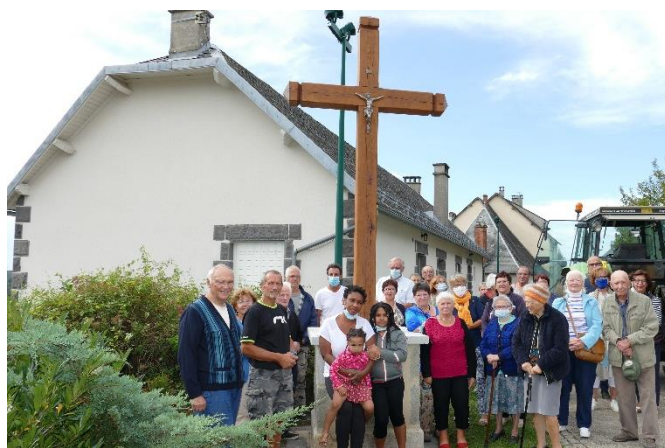
Mise en place de la croix dans le bourg (Larodde, Mémoire et Patrimoine) 19.09.2020