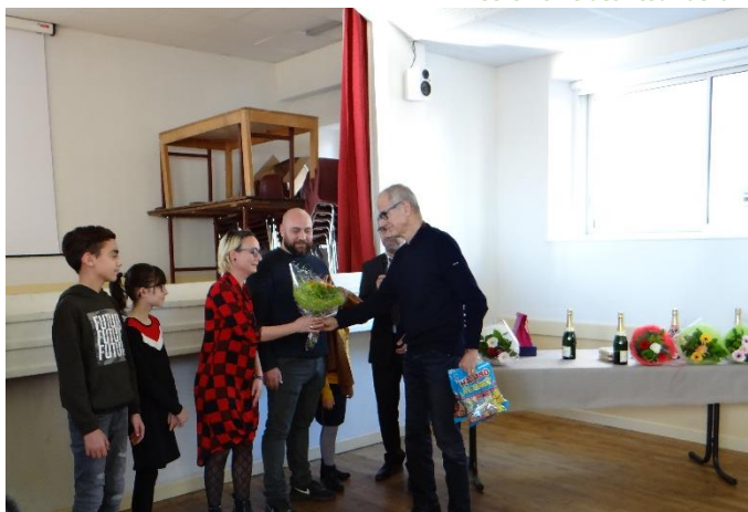
Accueil des nouveaux habitants