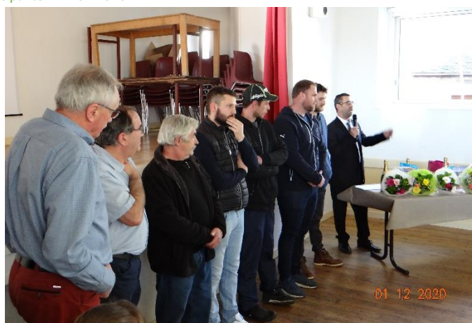
Remise de récompenses aux agriculteurs qui ont fait preuve de solidarité lors du feu de broussaille à Pérignat