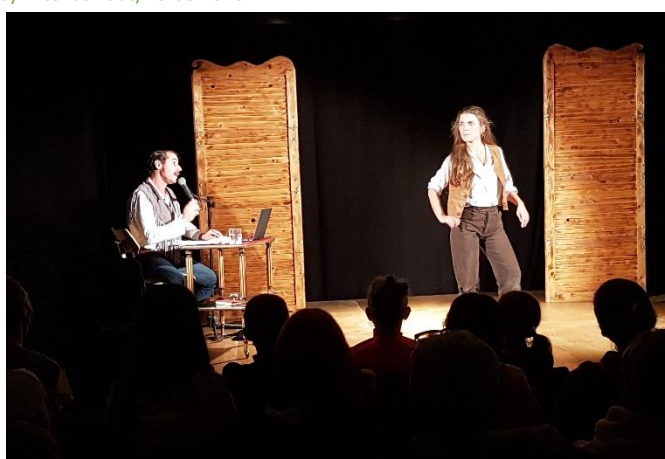
Spectacle « Wanted » Artenscene- 16.10.2020