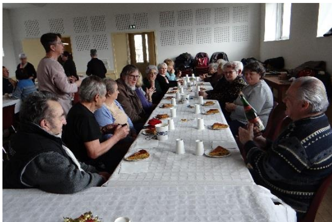
Galette des rois organisée par Loisirs et Partage - 8.01.2020