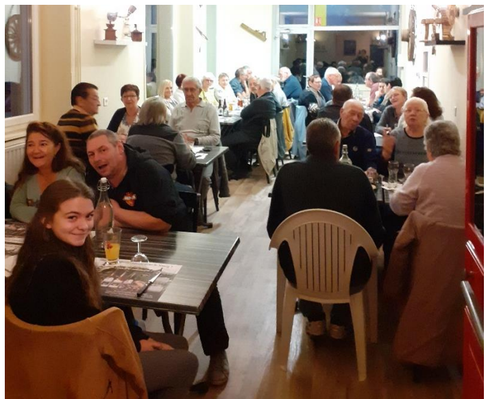
Organisation de repas à thème (choucroute, couscous...)