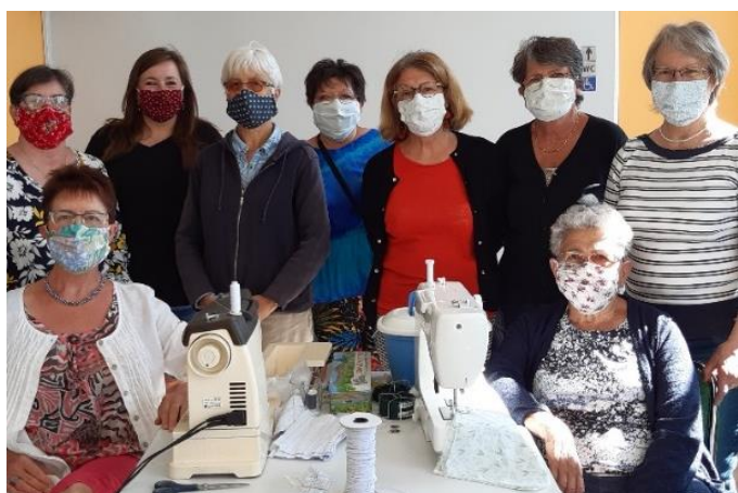
Confection de 460 masques par l'association Loisirs et Partage