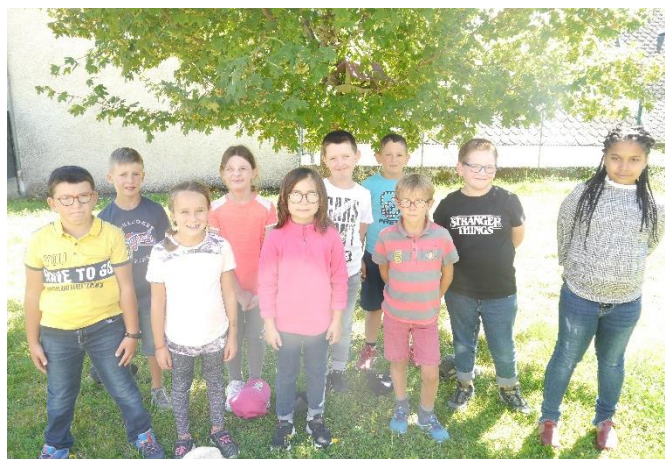
Rentrée scolaire 2020-2021