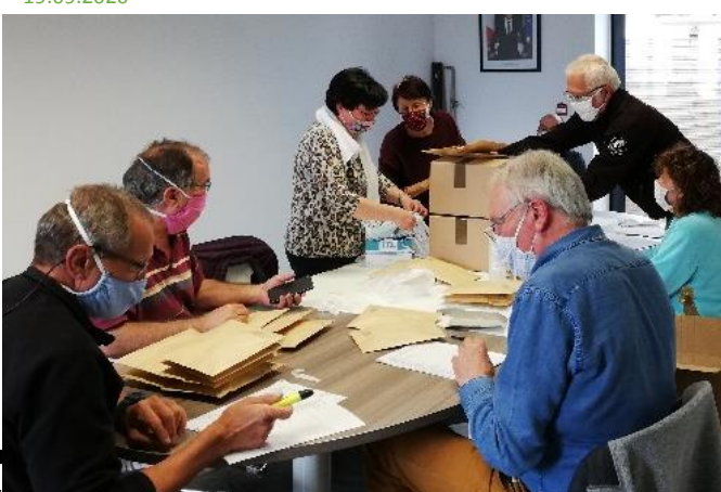
Distribution de masques par les élus à tous les habitants