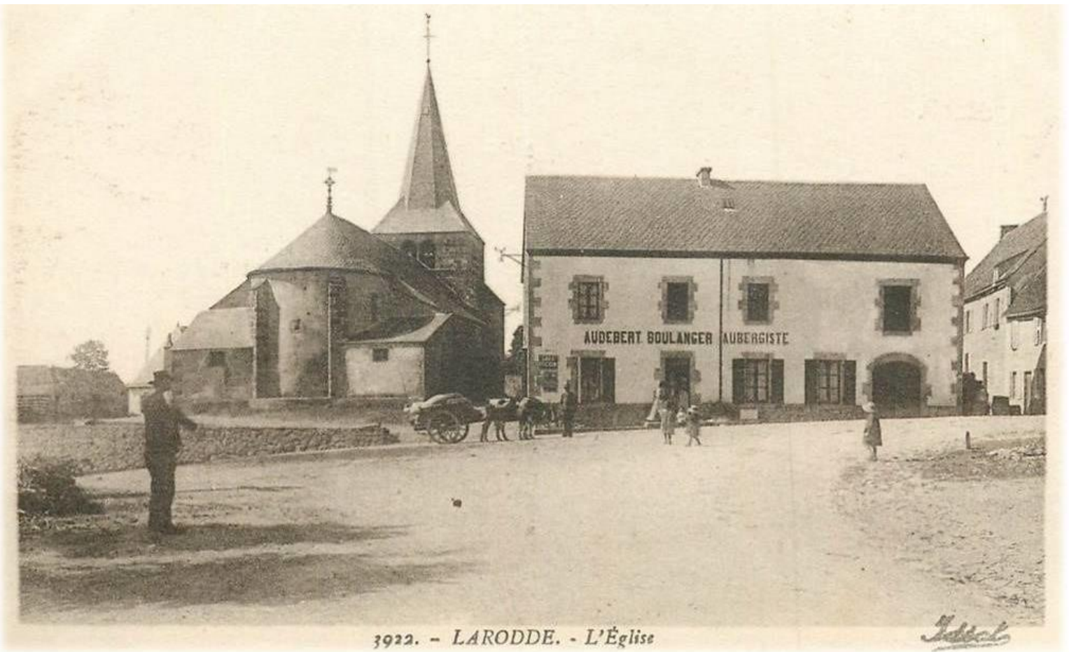
3922. - LARODDE. - L'Église