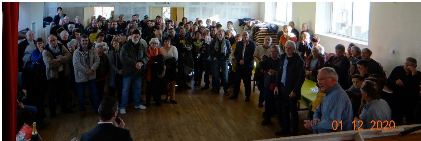
Cérémonie des vœux de la municipalité – 12.01.2020